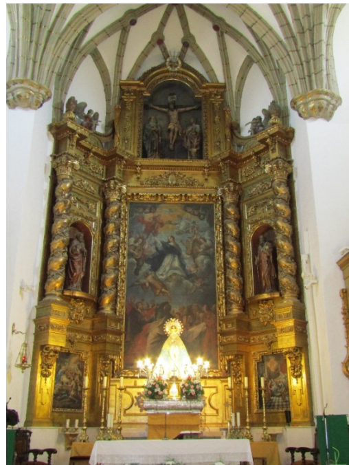
Retablo Mayor de la iglesia de la Asunción, Corral de Almaguer

No se puede entender el arte en el Priorato sin atender a lo que ocurre en su periferia y por ello extendemos nuestro ámbito de estudio hacia otras investigaciones que versen sobre las producciones artísticas de zonas colindantes sometidas o alejadas de la jurisdicción de esta Orden Militar como lo son el Campo de Montiel, la amplitud territorial de Ocaña o el Obispado de Cuenca. Del mismo modo, hacia estudios centrados en espacios jurisdiccionales similares al de esta investigación ya sean de la Orden Militar de Santiago como lo es el Priorato de San Marcos de León, o pertenecientes a otras