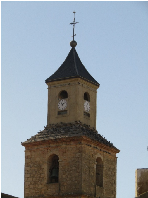
Detalle de la torre de la iglesia de la Asunción, Villamayor de Santiago.

Dicho esto, cabe plantearnos otra cuestión de importancia que, a su vez, nos permite conectarla con otro propósito de esta investigación. Al encontrarnos en un marco jurisdiccional concreto, nos proponemos averiguar hasta qué punto las manifestaciones artísticas parten de la propia Orden de Santiago y, por el contrario, qué volumen de producción artística parte de la iniciativa privada.