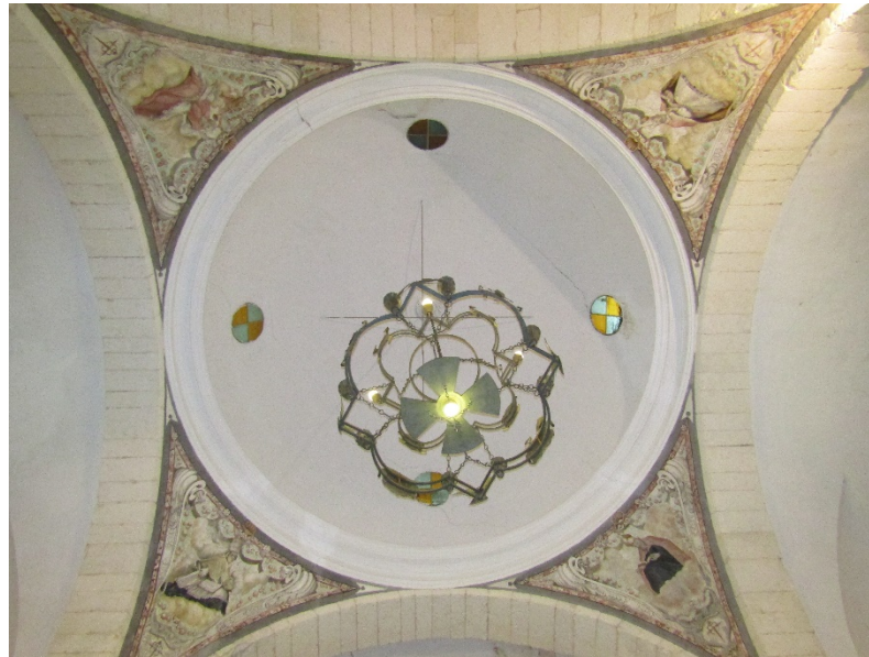
Cupula en el crucero de la iglesia de San Bernabe, Hinojosa de la Orden.

Órdenes Militares como el Priorato de San Juan. Todo ello con la finalidad de observar y fijar un marco comparativo que nos permita señalar o declinar características artísticas propias del Priorato de Uclés.