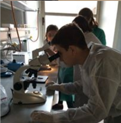
Laboratorios de docencia