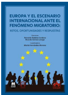
Europa y el escenario internacional ante el fenómeno migratorio: Retos, oportunidades y respuestas. Batista Cordova, Reinaldo, y Gómez Laorga, Ricardo (Dirs.) Editorial Colex. 2025