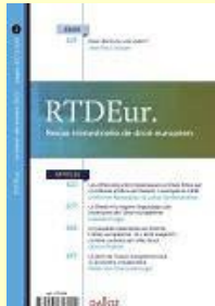
RTDEur. Revue trimestrielle de droit européen