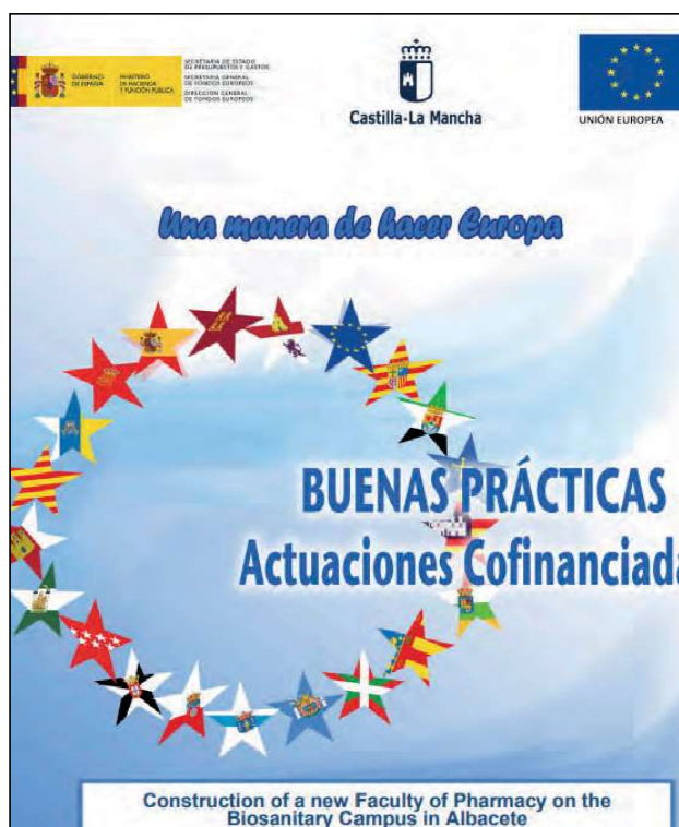
Foto VEP.2. Regiones Transición. P.O. Castilla La Mancha (hacienda.gob.es)

Por parte de la Viceconsejería de Empleo y Relaciones Laborales, como organismo regional responsable de la ejecución